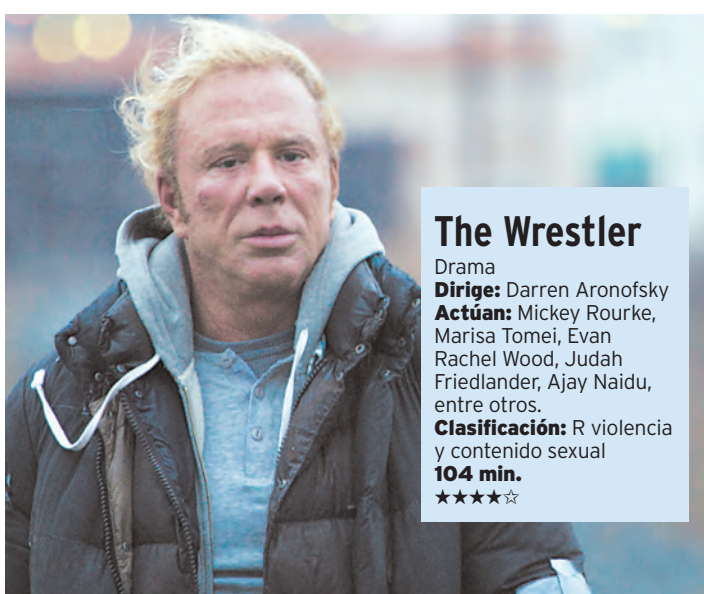
Mickey Rourke es Randy The Ram Robinson en la cinta The Wrestler .

Este agresivo retrato del mundo de la lucha profesional refleja una vez más y sin tapujos el singular estilo de dirección del llamado niño maravilla de Hollywo-